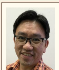
邓维信传道 (圣安德烈座堂华文部)

实体课程 – 善牧堂 2 Dundee Road, Singapore 149454