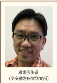
邓维信传道 (圣安德烈座堂华文部)

实体课程 – 善牧堂 2 Dundee Road, Singapore 149454