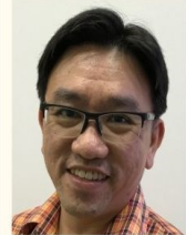
邓维信传道 (圣安德烈座堂华文部)

实体课程 – 善牧堂 2 Dundee Road, Singapore 149454