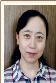
戴艳杰传道 (诸圣堂)

本书是以色列从【神治政体】转为【君主政体】的叙事。以三位主要人物撒母耳、扫罗、大卫为中心展开叙述，它更像一部传奇人物故事。谁主沉浮？历史没有“如果”，最终神说得算！本书将以灵修的方式来学习，以人物和事件的省思带给我们属灵的洞见，帮助我们心中有神，建立与神亲密的互动关系，成为合神心意的人。让我们一同探索此书，期待其中的属灵教训帮助建立我们的生命，造就灵性都获益匪浅！